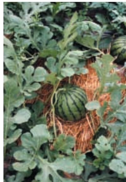
図-2 ‘姫しずか’の果実(左)と栽培状況(右)