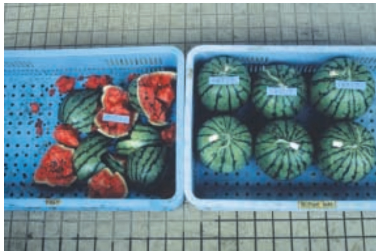
図-3 ‘姫しずか’の耐輸送性検定

左側から1：‘マダーボール’，2：‘KWMP-2’，3：‘姫しずか’，4：‘KWMP-1’