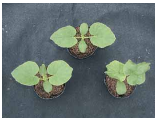
図-3 アブラムシ放飼による縮葉検定 抵抗性：上；‘アールス輝’，左下；‘久留米 MP-4’， 感受性：右下；‘アールス雅’，縮葉が認められる。

‘アールス輝’は，つる割病（レース2）に対し，標準品種と同様に，抵抗性を示す（表-4）。