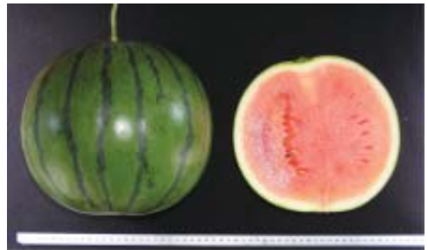
図-3 「すいか中間母本農1号」の果実 (2007年6月14日撮影)