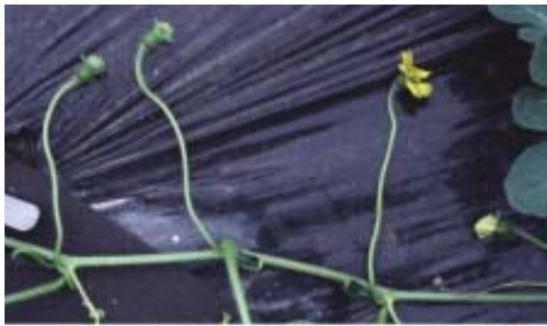
図-2 「すいか中間母本農1号」の両性花着生状況 (左上の2つは両性花の蕾) (2004年5月15日撮影：三重県津市安濃町)

「すいか中間母本農1号」の一果重は4.7kgと軽かった(表-5)。果梗長は長く、果実は扁平、花落ち痕は大きかった。空洞果の発生は100%であった。果皮の色は緑で、黒色の細い条斑が認められた。果皮は厚く、弾力性があった。果肉は紅色で軟らかく、シャリ感は少なかった。糖度は「都3号」と同等の値を示した。