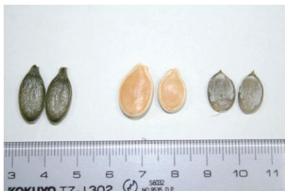
食用種子ペポカボチャ品種の種子の外観。左が「ストライプペポ」種子、真ん中が普通種子(殻あり)、右は普通種子から殻を剥いたもの

「ストライプペポ」の作付面積は、寒地・寒冷地にあたる北海道および東北地方の3道県で約10ha作付けされています。これは、北海道におけるズッキーニ栽培の面積とほぼ同じで、約9割は上川郡和寒町で作付けされています。和寒町と道総研が協力して6次産業化の素材に用いられ、商品開発が行われています。種子をトッピングしたお菓子が販売されたことに加えて、表で示すように水分が多く糖質が低いため今まで使われることのなかった果肉を活用したお菓子も開発され、今年に入って販売されるに至りました。これら商品は、和寒町や札幌市内の土産物店で販売されています。