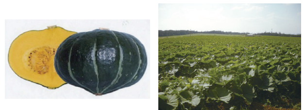
「TC2A」（左）、「ジェジェ」の栽培風景（右） （沖縄県南大東島）

全国の産地に向けた端境期出荷用の貯蔵性が高い加工用品種の開発は今も続いています。