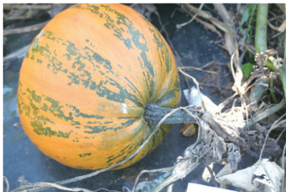
「ストライプペポ」の果実

「ストライプペポ」はズッキーニなどのペポカボチャ ( C. pepo ) に属しているオレンジ色の肌に緑色の縞が入っている品種で、2014年に品種登録されました。果実の大きさも4kg台と大きいこともあって、最初は変わったスイカと勘違いする方もいました。この品種の大きな特徴は、種子に厚い殻ができませんので、直接お菓子のトッピングやおつまみに使えるという点です。