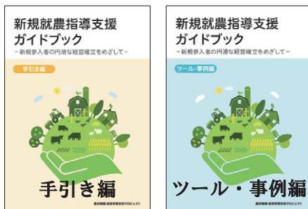
図1 ガイドブックの表紙