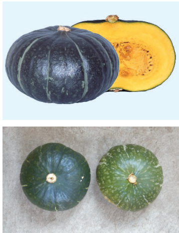
「ジェジェ」の果実(上)、貯蔵3ヶ月後でも皮色が濃い「ジェジェ」(下:左)と、皮色があせた「えびす」(下:右) ※色あせると果肉の品質が悪くなる。