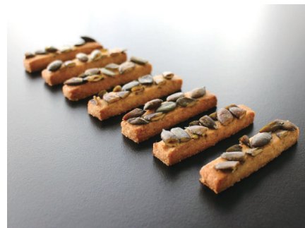
「ストライプペポ」食用種子を使ったお菓子たち

これらに限らず、「ストライプペポ」の開発をキー技術とし、大学や企業等との連携による食品加工技術の開発が現在も行われており、どのような形で「ストライプペポ」が皆さんにお会いできるかとても楽しみです。