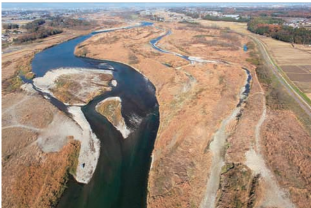
(e) 下流側から 7/8 (2010年11月30日)