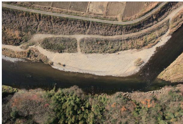
(e) 上流側から 3/6 (2010年11月30日)