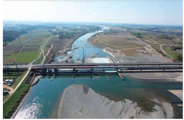
(b) 上流側から 5/8 (2011年11月4日)