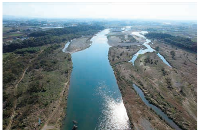
(d) 上流側から 2/8 (2011年11月4日)