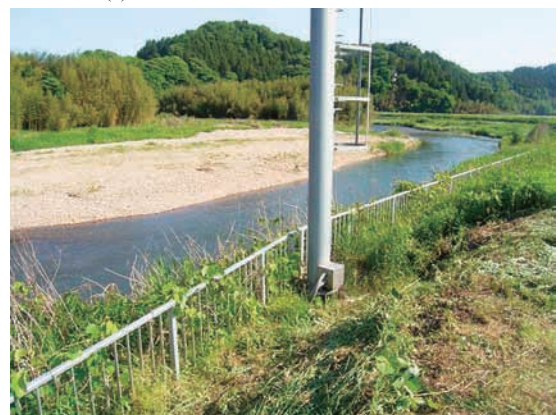
(d) 上流側から 4/4 (2010年6月2日)