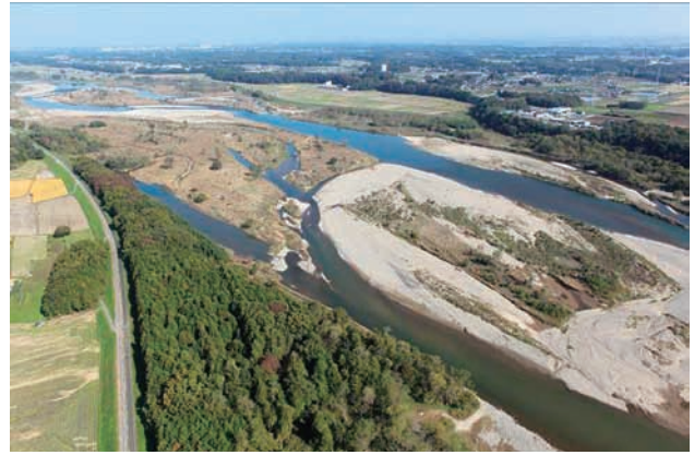
(b) 下流側から 5/8 (2011年11月4日)