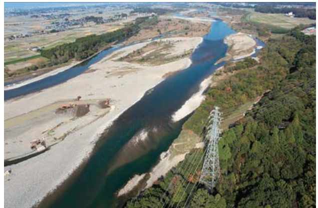
(h) 下流側から 4/8 (2011年11月4日)