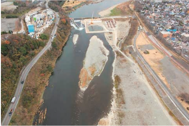
(a) 下流側から 1/6 (2010年12月21日)