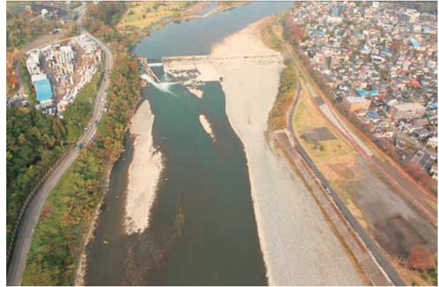
(b) 下流側から 1/6 (2011年11月15日)