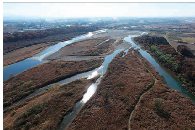
(e) 上流側から 3/8 (2010年11月30日)