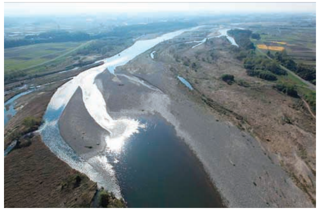
(b) 上流側から 1/8 (2011年11月4日)