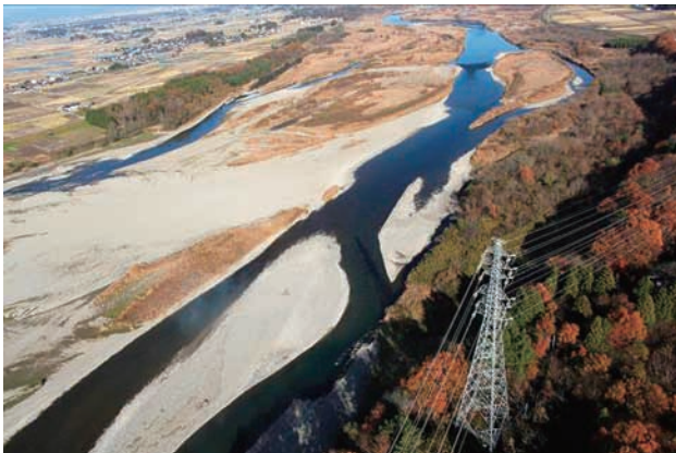
(g) 下流側から 4/8 (2010年11月30日)