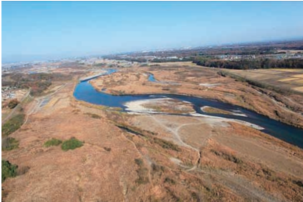
(c) 下流側から 6/8 (2010年11月30日)