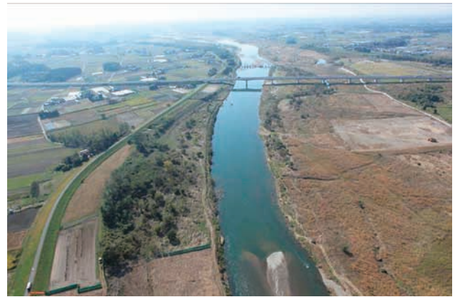
(h) 上流側から 8/8 (2011年11月4日)