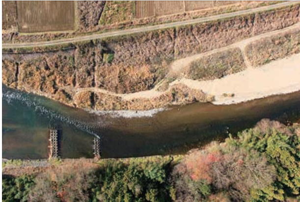
(a) 上流側から 4/6 (2010年11月30日)