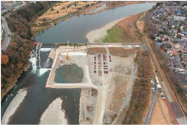
(c) 下流側から 2/6 (2010年12月21日)