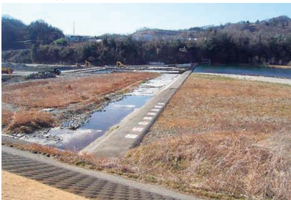
(c) 上流側から 3/4 (2010年1月26日)