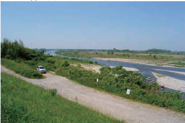
(d) 上流側から 4/4 (2010年6月2日)