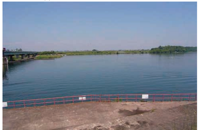
(c) 上流側から 3/4 (2010年6月2日)