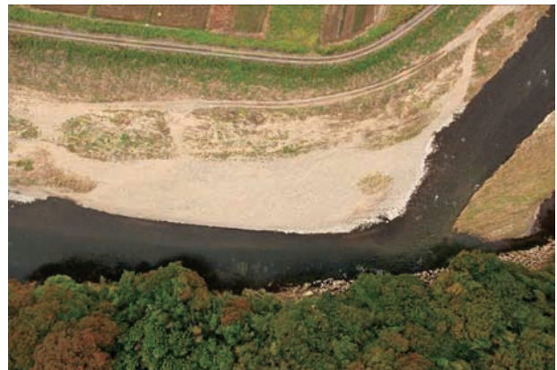
(f) 上流側から 3/6 (2011年10月21日)