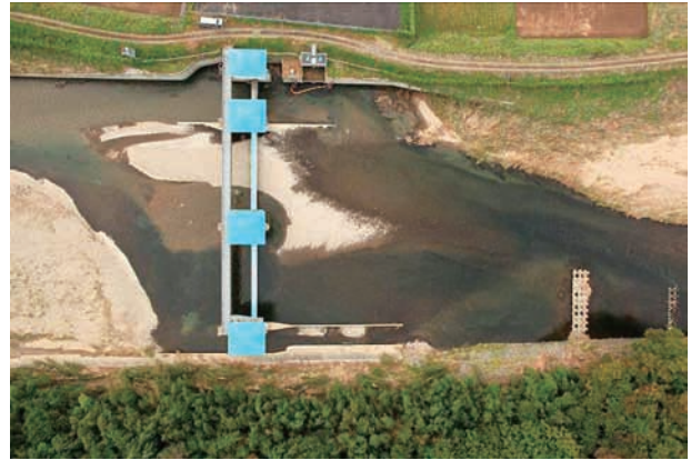
(d) 上流側から 5/6 (2011年10月21日)