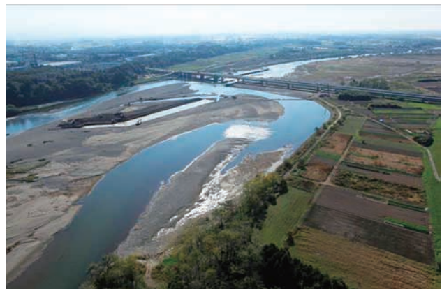
(h) 上流側から 4/8 (2011年11月4日)