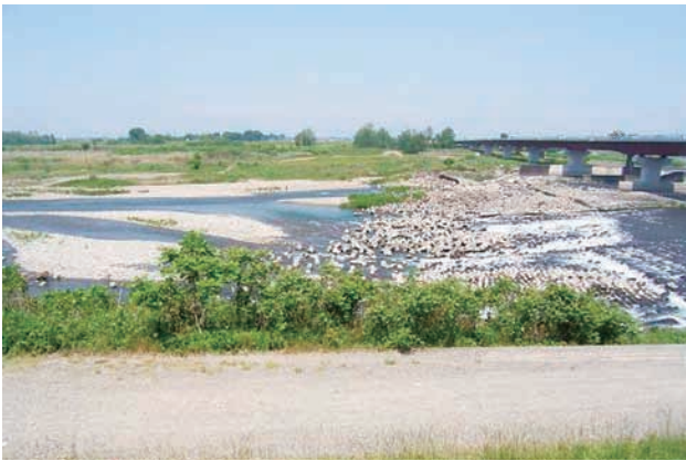
(b) 上流側から 2/4 (2010年6月2日)