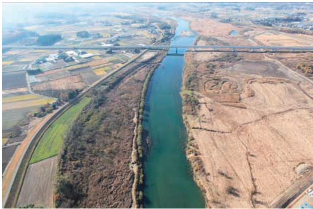
(g) 上流側から 8/8 (2010年11月30日)