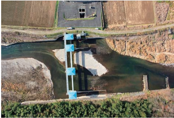
(c) 上流側から 5/6 (2010年11月30日)