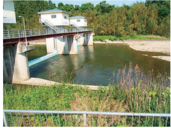
(a) 上流側から 1/4 (2010年6月2日)