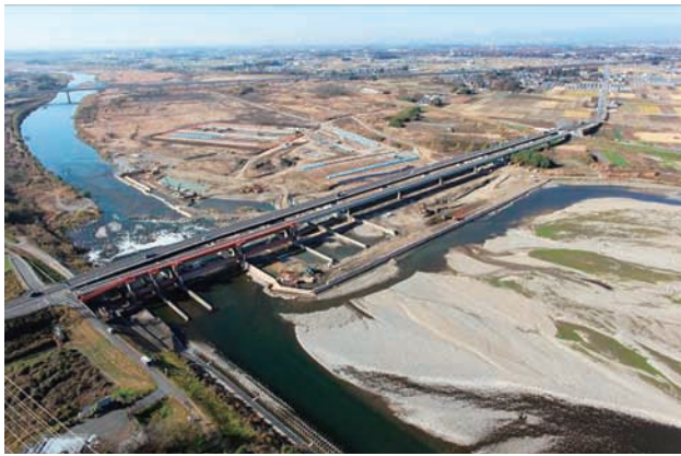
(c) 上流側から 6/8 (2010年11月30日)