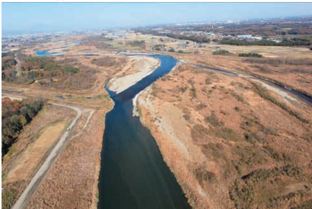
(g) 下流側から 8/8 (2010年11月30日)