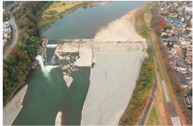
(d) 下流側から 2/6 (2011年11月15日)