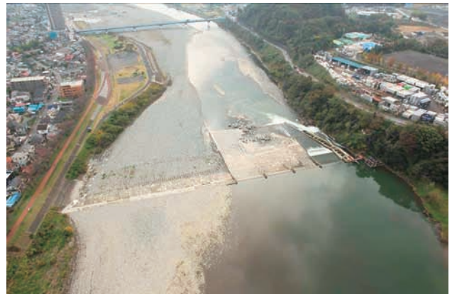
(b) 上流側から 4/6 (2011年11月15日)