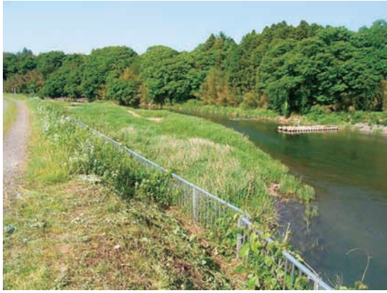
(a) 上流側から 1/4 (2010年6月2日)