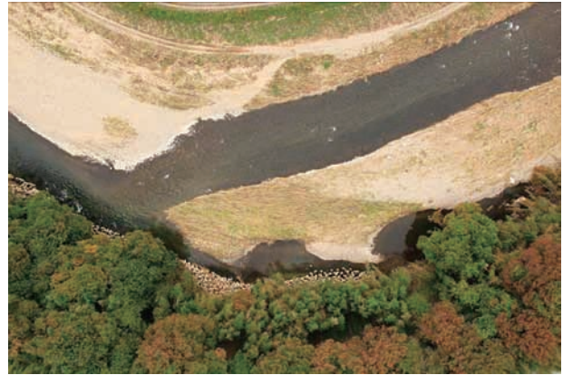
(d) 上流側から 2/6 (2011年10月21日)