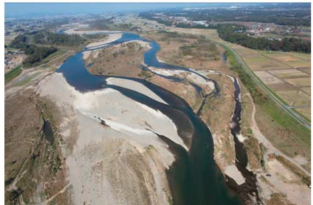
(f) 下流側から 7/8 (2011年11月4日)