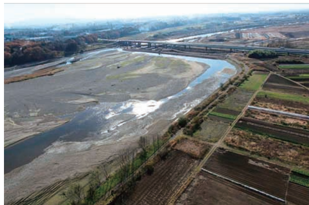
(g) 上流側から 4/8 (2010年11月30日)