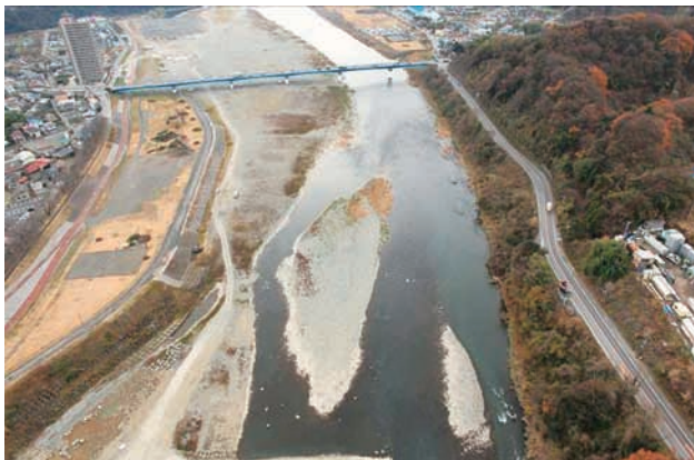
(c) 上流側から 5/6 (2010年12月21日)