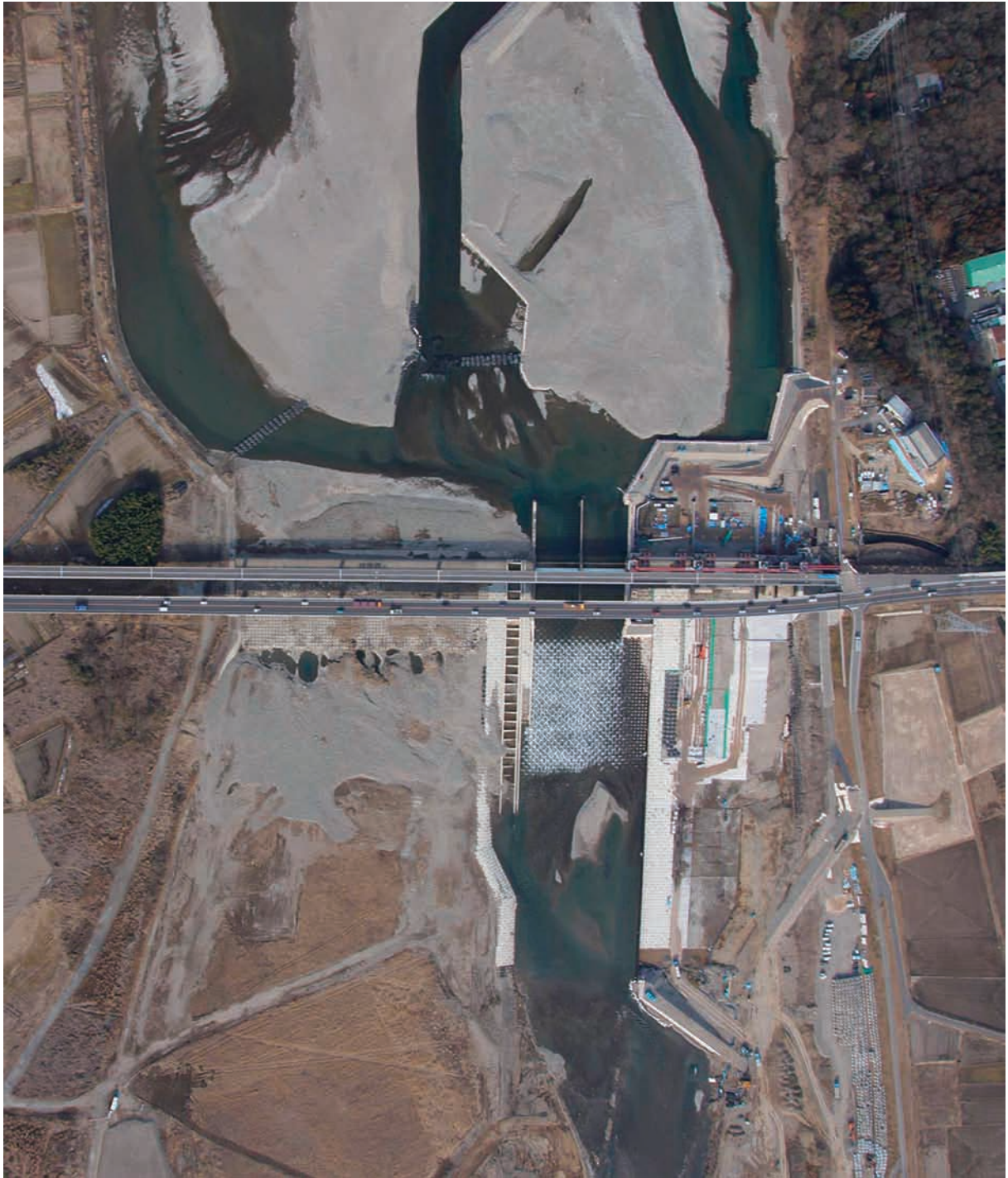
Fig.22 勝瓜頭首工近傍を鉛直下向きで撮影した結果 Photograph of neighborhood of the Katsu-uri headworks in vertical direction