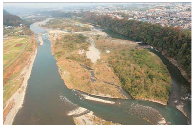
(f) 下流側から 6/6 (2011年11月15日)