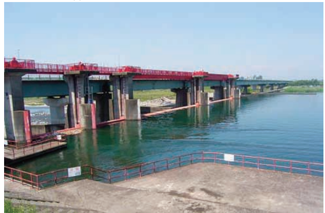
(d) 上流側から 4/4 (2010年6月2日)