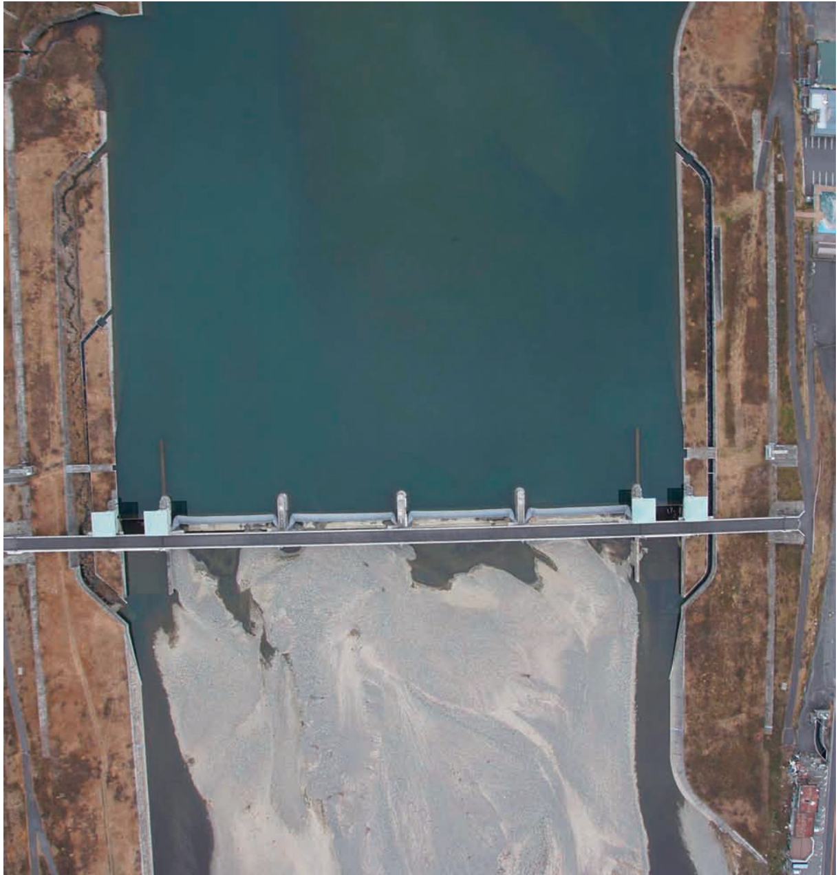
Fig.27 石部頭首工近傍を鉛直下向きで撮影した結果 Photograph of neighborhood of the Ishibe headworks in vertical direction