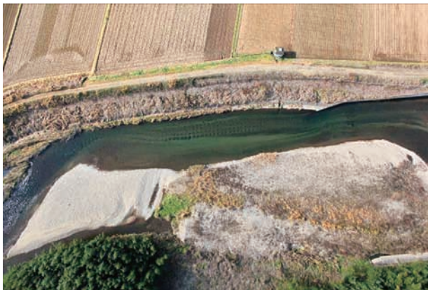
(e) 上流側から 6/6 (2010年11月30日)