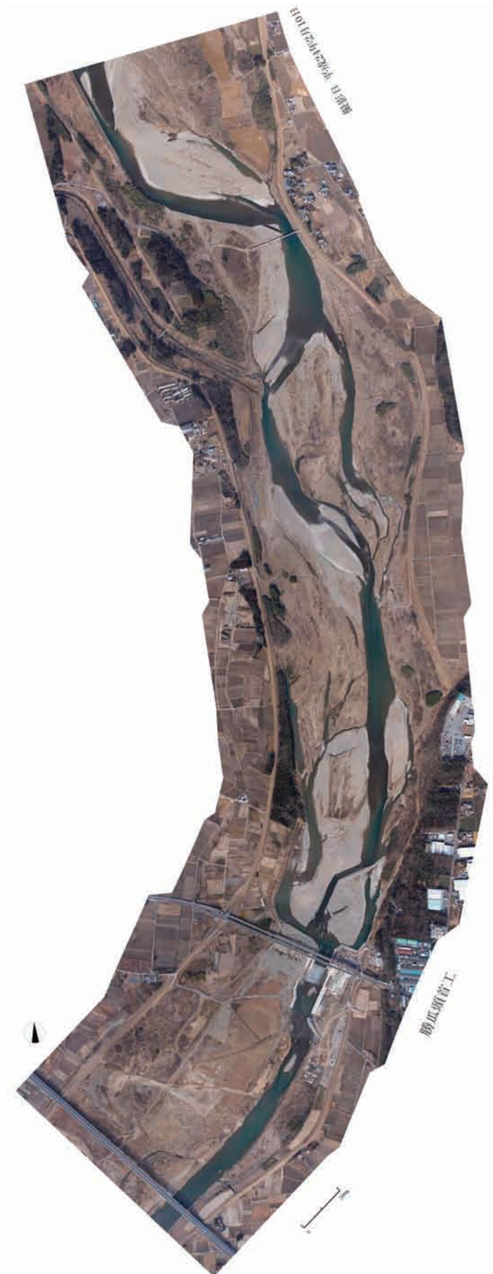
Fig.21 勝瓜頭首工の堆砂除去目安範囲の全体を鉛直下向きで撮影した結果 Photograph of standard range for removing sediment of the Katsu-uri headworks in vertical direction