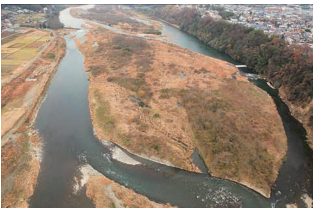
(e) 下流側から 6/6 (2010年12月21日)