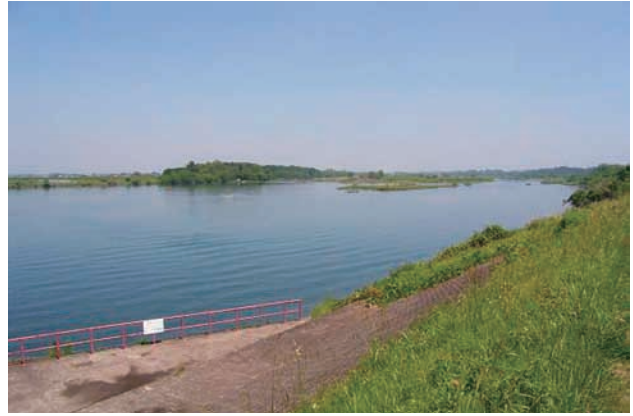
(a) 上流側から 1/4 (2010年6月2日)