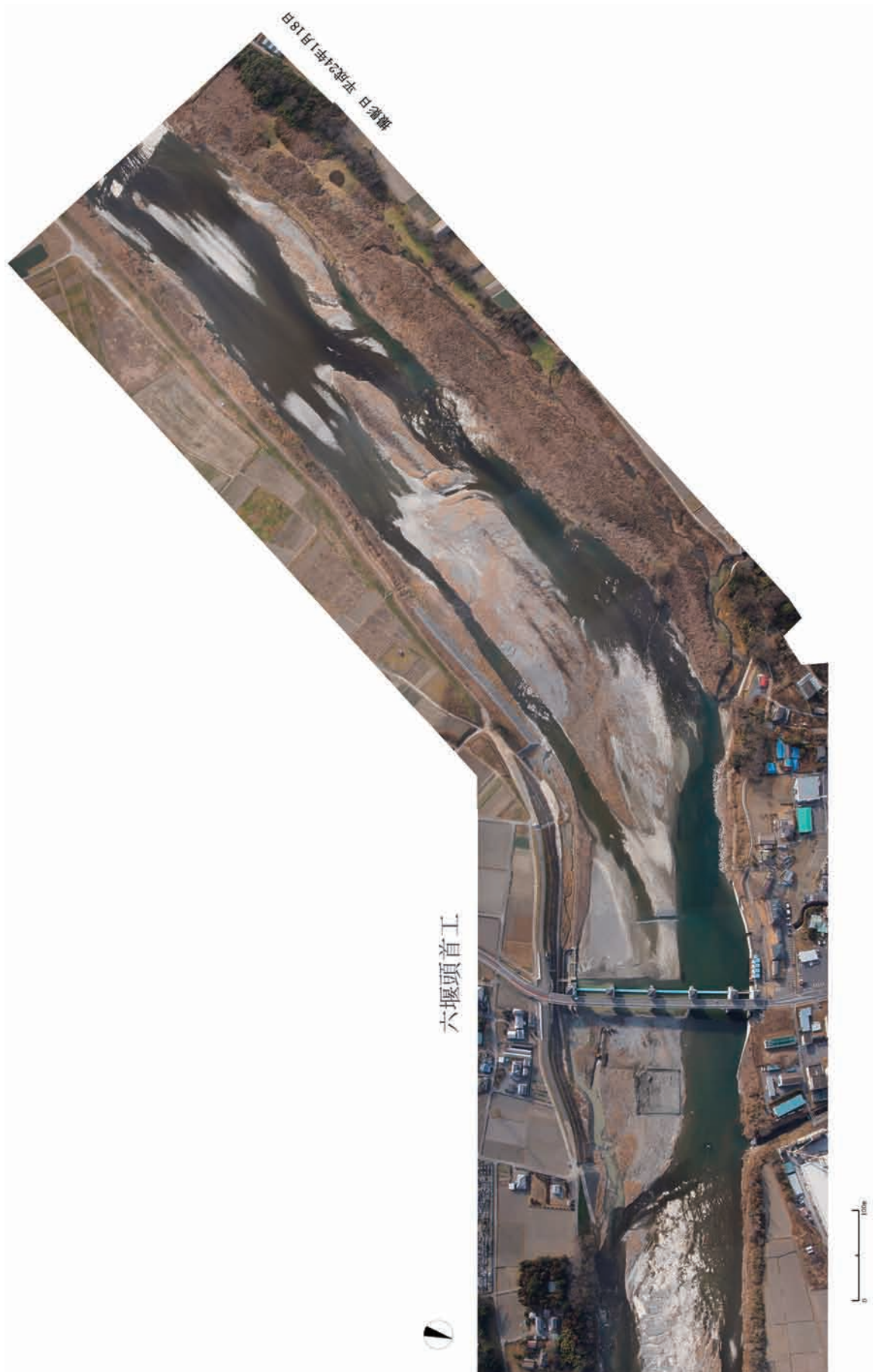
Fig.23 六堰頭首工の堆砂除去目安範囲の全体を鉛直下向きで撮影した結果 Photograph of standard range for removing sediment of the Rokuzeki headworks in vertical direction