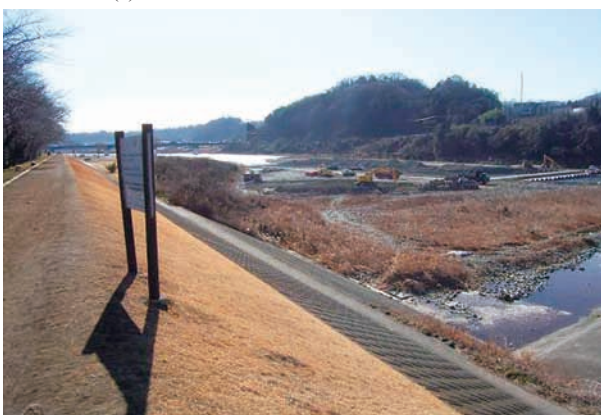
(d) 上流側から 4/4 (2010年1月26日)