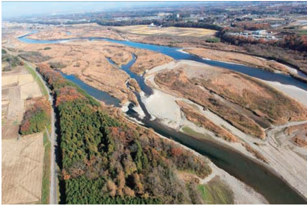
(a) 下流側から 5/8 (2010年11月30日)