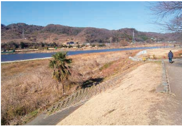
(a) 上流側から 1/4 (2010年1月26日)