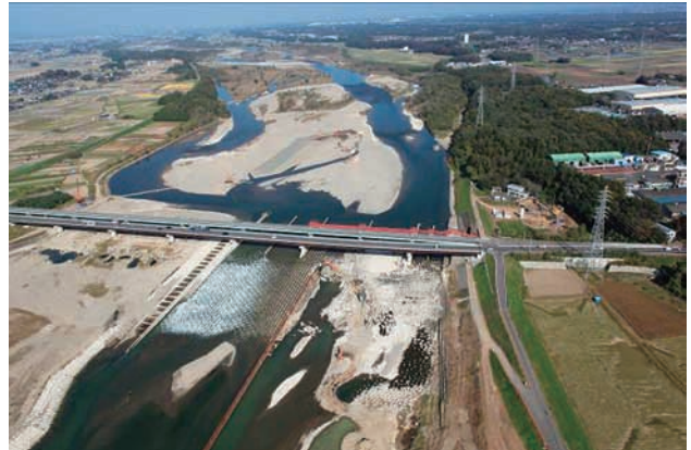
(d) 下流側から 2/8 (2011年11月4日)