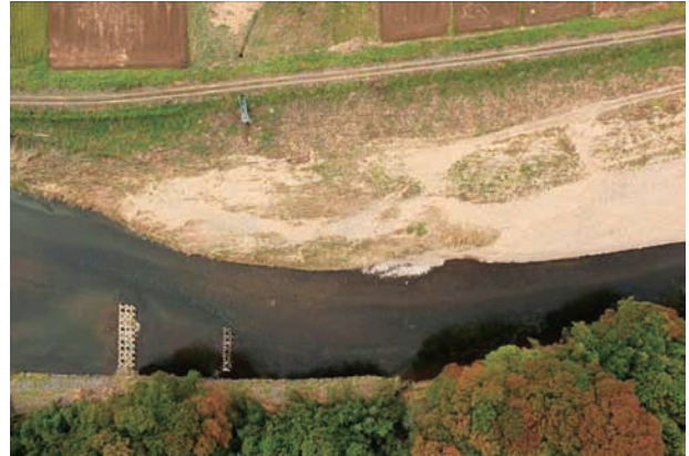
(b) 上流側から 4/6 (2011年10月21日)