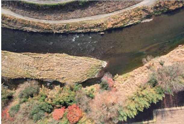
(a) 上流側から 1/6 (2010年11月30日)