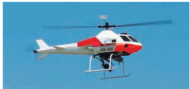
Fig.2 SF125T-IV SF125T-IV