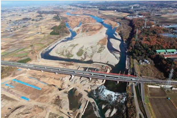
(c) 下流側から 2/8 (2010年11月30日)