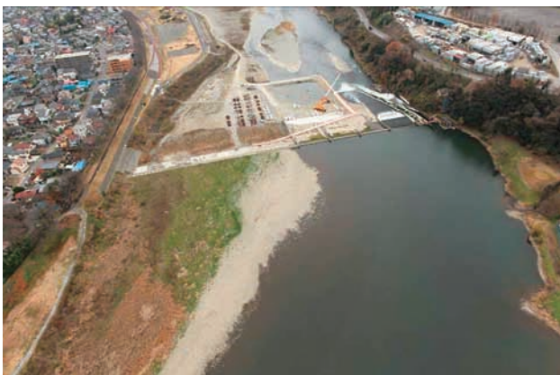
(e) 上流側から 3/6 (2010年12月21日)