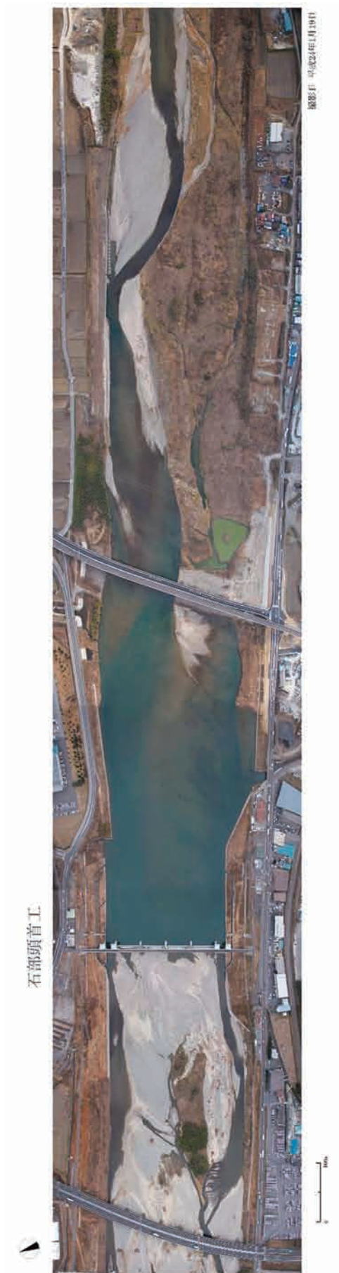
Fig.26 石部頭首工の堆砂除去目安範囲の全体を鉛直下向きで撮影した結果 Photograph of standard range for removing sediment of the Ishibe headworks in vertical direction