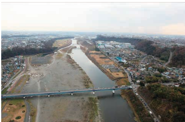
(e) 上流側から 6/6 (2010年12月21日)