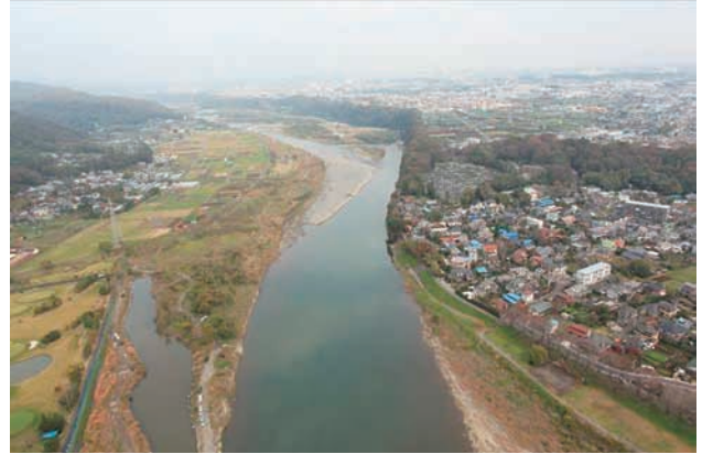
(b) 下流側から 4/6 (2011年11月15日)