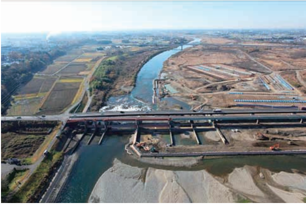
(a) 上流側から 5/8 (2010年11月30日)