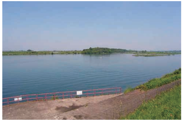
(b) 上流側から 2/4 (2010年6月2日)