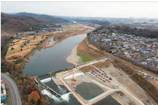
(e) 下流側から 3/6 (2010年12月21日)