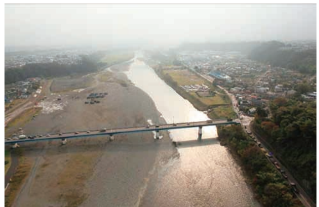
(f) 上流側から 6/6 (2011年11月15日)