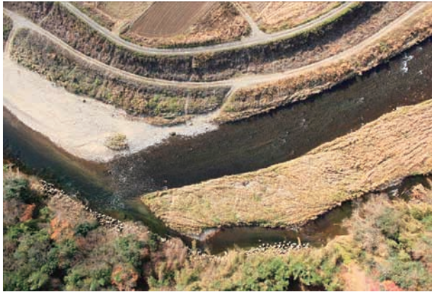
(c) 上流側から 2/6 (2010年11月30日)