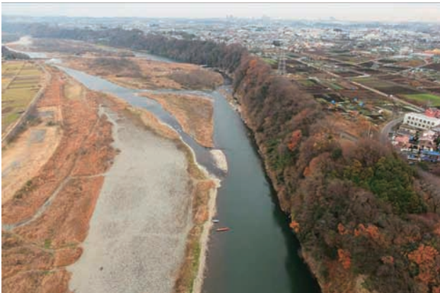
(c) 下流側から 5/6 (2010年12月21日)