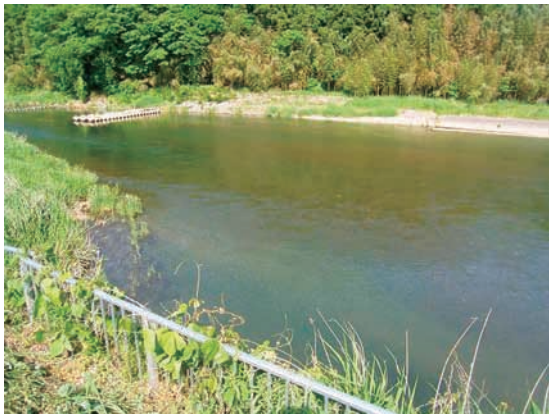
(b) 上流側から 2/4 (2010年6月2日)