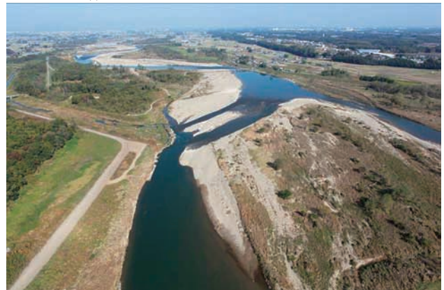
(h) 下流側から 8/8 (2011年11月4日)