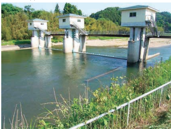
(d) 上流側から 4/4 (2010年6月2日)