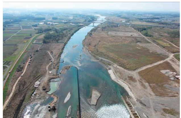
(f) 上流側から 7/8 (2011年11月4日)