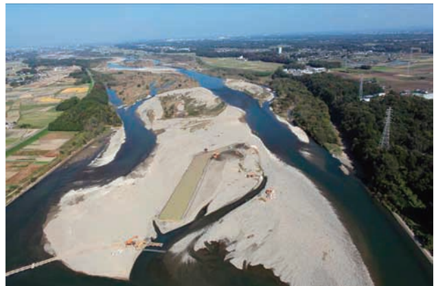
(f) 下流側から 3/8 (2011年11月4日)