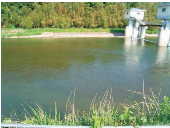
(c) 上流側から 3/4 (2010年6月2日)