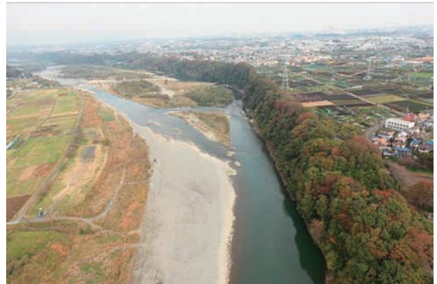
(d) 下流側から 5/6 (2011年11月15日)