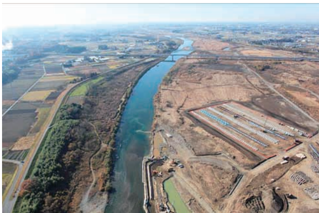
(e) 上流側から 7/8 (2010年11月30日)