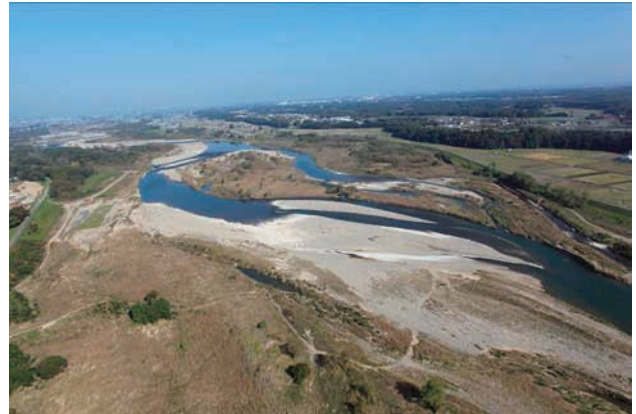
(d) 下流側から 6/8 (2011年11月4日)