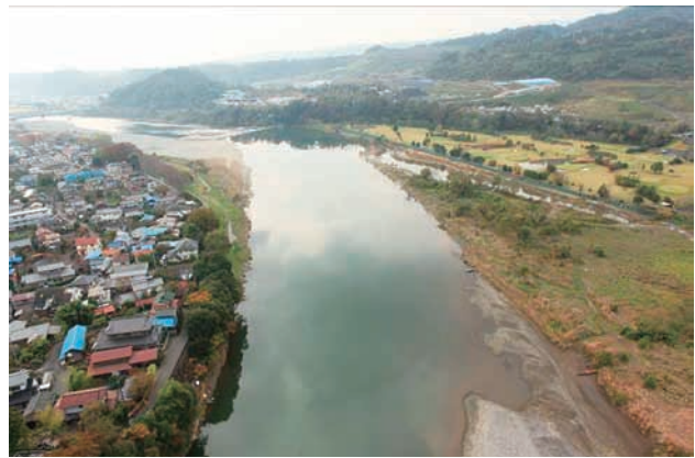
(d) 上流側から 2/6 (2011年11月15日)