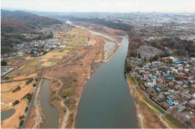
(a) 下流側から 4/6 (2010年12月21日)