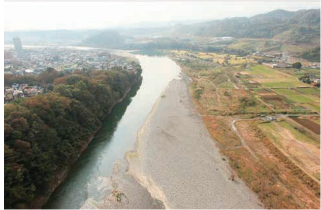
(b) 上流側から 1/6 (2011年11月15日)