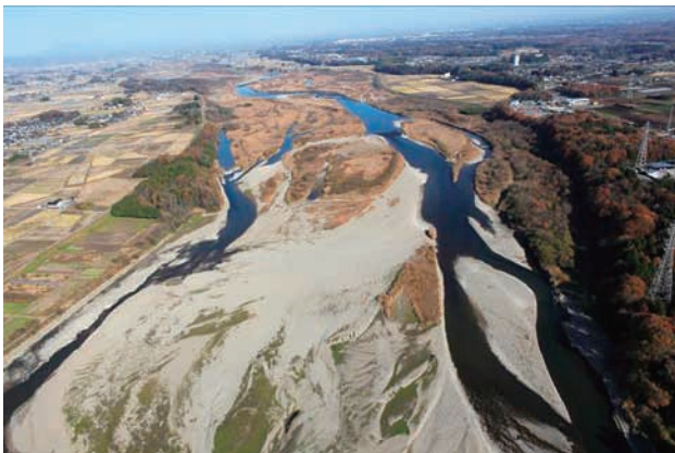
(e) 下流側から 3/8 (2010年11月30日)