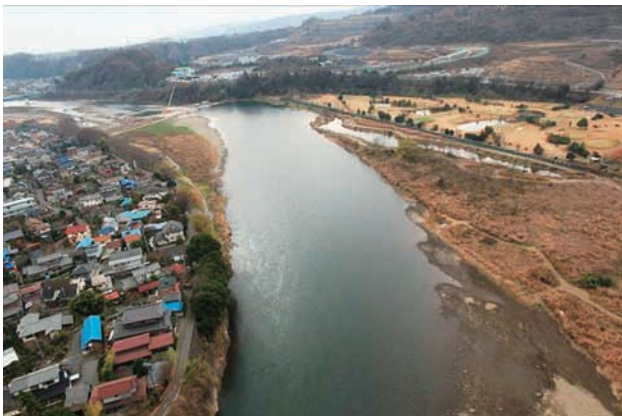
(c) 上流側から 2/6 (2010年12月21日)