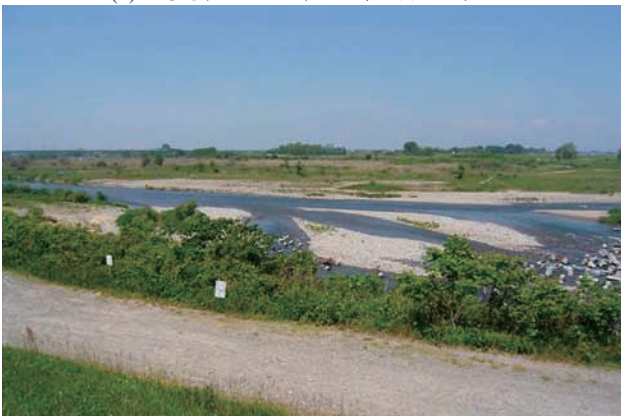
(c) 上流側から 3/4 (2010年6月2日)