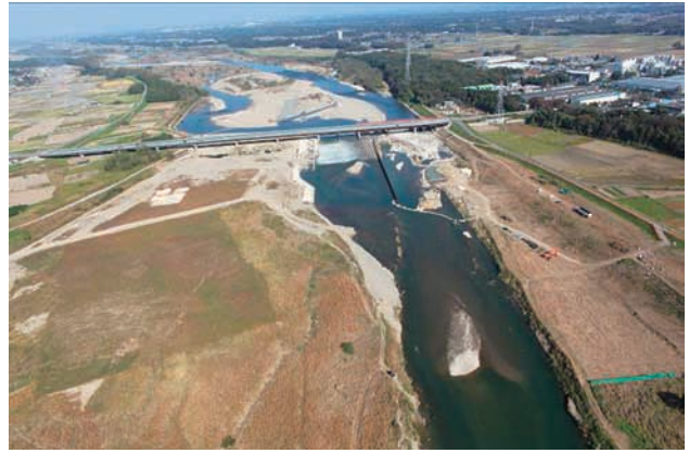
(b) 下流側から 1/8 (2011年11月4日)