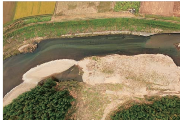
(f) 上流側から 6/6 (2011年10月21日)