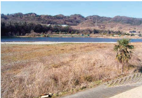
(b) 上流側から 2/4 (2010年1月26日)