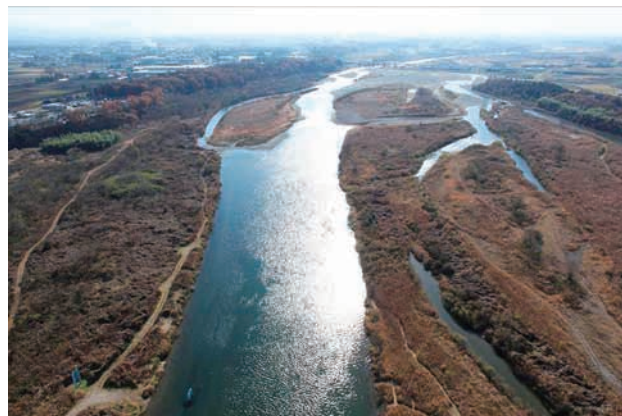
(c) 上流側から 2/8 (2010年11月30日)