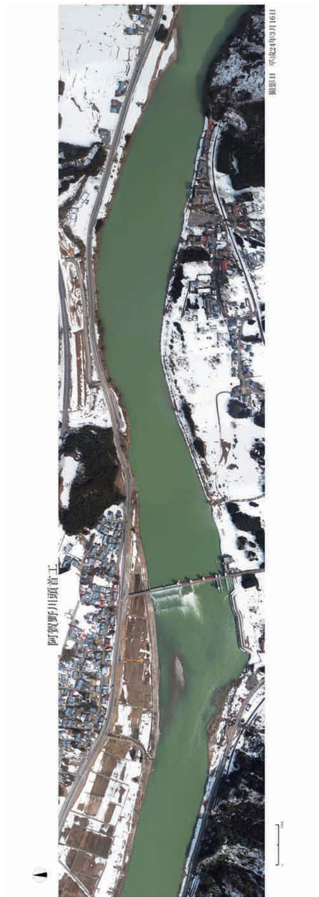
Fig.25 阿賀野川頭首工の堆砂除去目安範囲の全体を鉛直下向きで撮影した結果 Photograph of standard range for removing sediment of the Aganogawa headworks in vertical direction