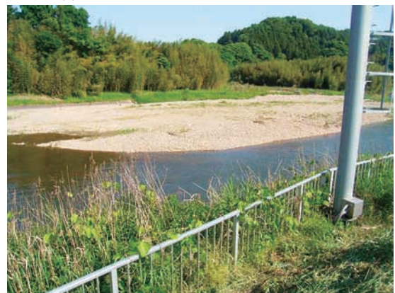
(c) 上流側から 3/4 (2010年6月2日)