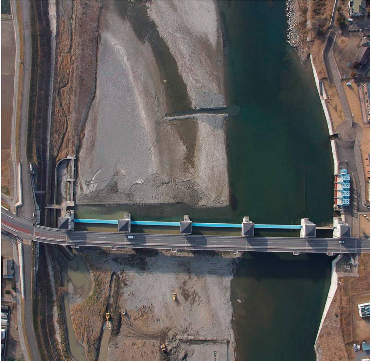
Fig.24 六堰頭首工近傍を鉛直下向きで撮影した結果 Photograph of neighborhood of the Rokuzeki headworks in vertical direction