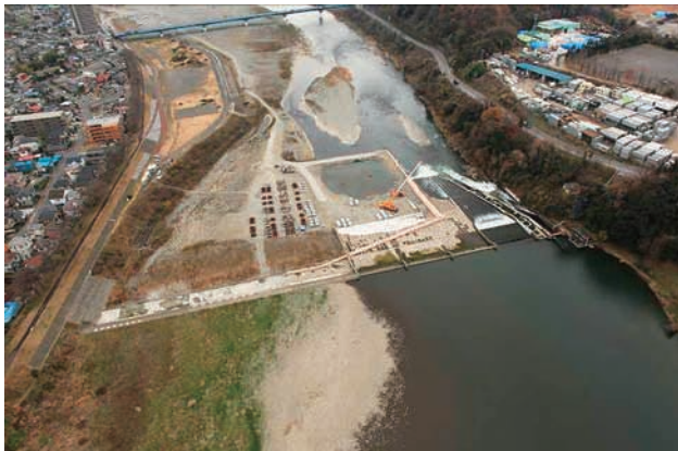
(a) 上流側から 4/6 (2010年12月21日)