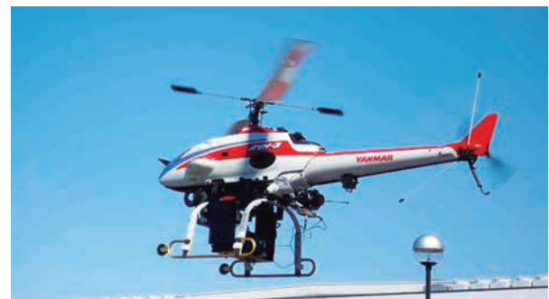
Fig.1 RMAX Type II RMAX Type II