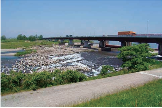
(a) 上流側から 1/4 (2010年6月2日)