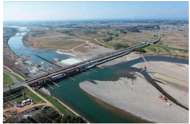
(d) 上流側から 6/8 (2011年11月4日)