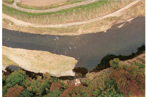
(b) 上流側から 1/6 (2011年10月21日)