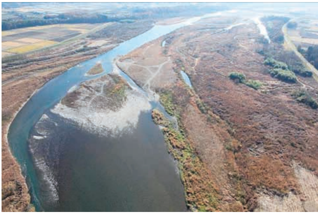
(a) 上流側から 1/8 (2010年11月30日)