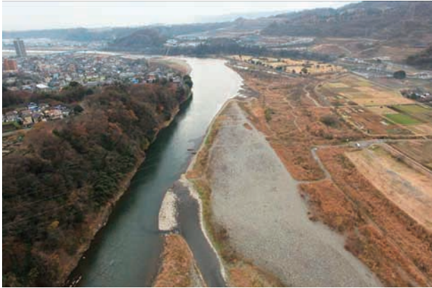
(a) 上流側から 1/6 (2010年12月21日)