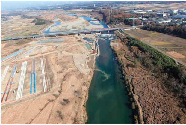
(a) 下流側から 1/8 (2010年11月30日)