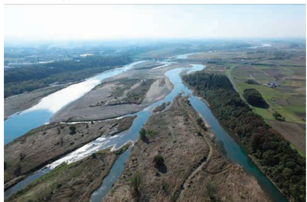
(f) 上流側から 3/8 (2011年11月4日)