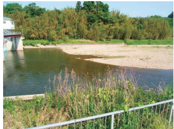
(b) 上流側から 2/4 (2010年6月2日)