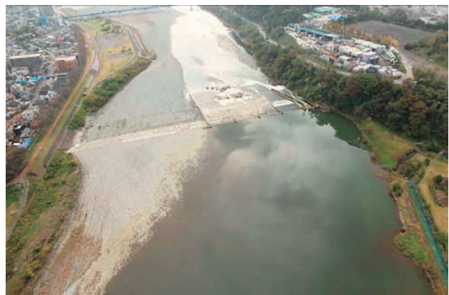
(f) 上流側から 3/6 (2011年11月15日)