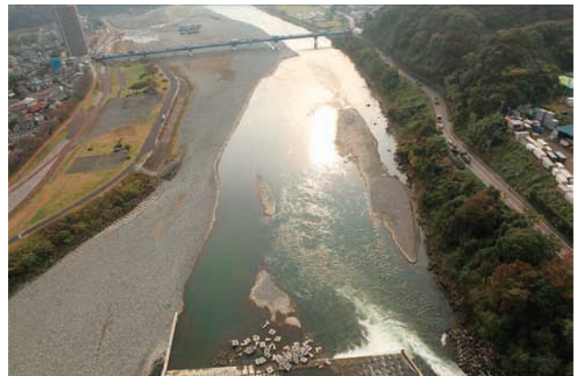
(d) 上流側から 5/6 (2011年11月15日)