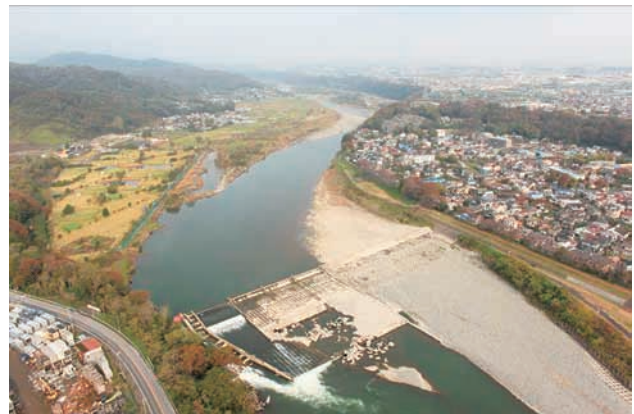
(f) 下流側から 3/6 (2011年11月15日)