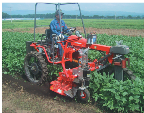
図1 強度可変中耕作業機