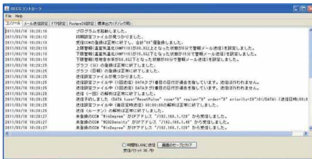
図-3 管理ソフトウェア起動時の様子

ソフトウェア起動すると5つのタブ画面を持つ起動画面が現れる。コンソール画面ではソフトウェアの動作状況を表示。メール送信設定、FTP設定、PostgreSQL設定画面はそれぞれ、外部へのデータ送信に利用するアカウントなどの設定を行う。標準出力は、デバッグ用の画面であり、管理ソフトウェアで解析できない異常が発生した時に原因を解析するために利用する。