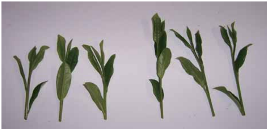
図-4 ‘しゅんたろう’の一番茶新芽の伸び