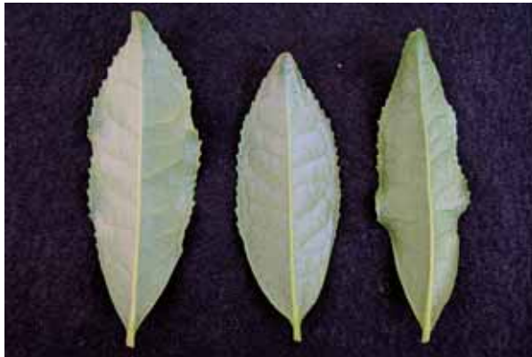
図-2 ‘しゅんたろう’成葉の形態