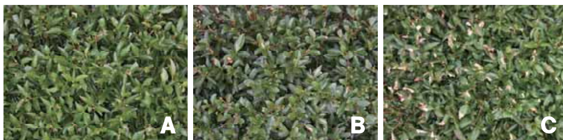
図-5 種子島における‘しゅんたろう’の炭疽病発生程度