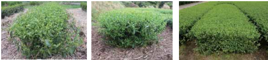
図-3 ‘しゅんたろう’の樹姿

一番茶の萌芽期は‘やぶきた’より2週間以上早く、‘くりたわせ’より1日程度早い。また、育成地での一番茶摘採期は‘やぶきた’より2週間以上早く、定植4年目の2008年には‘くりたわせ’より2日程度早かった。摘採期前の気温が高く、早生品種の摘採時期が全体的に早まった定植5年目の2009年は、‘くりたわせ’よりも7日早い摘採であった。種子島における摘採は2010年から開始され、一番茶の摘採日は2010年では3月27日で枕崎よりも6日早く、強い霜害を受けた2011年は4月5日で枕崎よりも1日早かった（表-4）。2010年および2011年の2ヶ年とも種子島における‘しゅんたろう’と‘くりたわせ’の摘採日が同日となった。これは、一番茶における最初の製造では、製茶機械の調整を行う必要があり、生産量が少なく1回しか製造できない‘しゅんたろう’による機械調整を避けるため、最も生育の進んだ‘くりたわせ’の製造日に摘採日を合わせたためである。