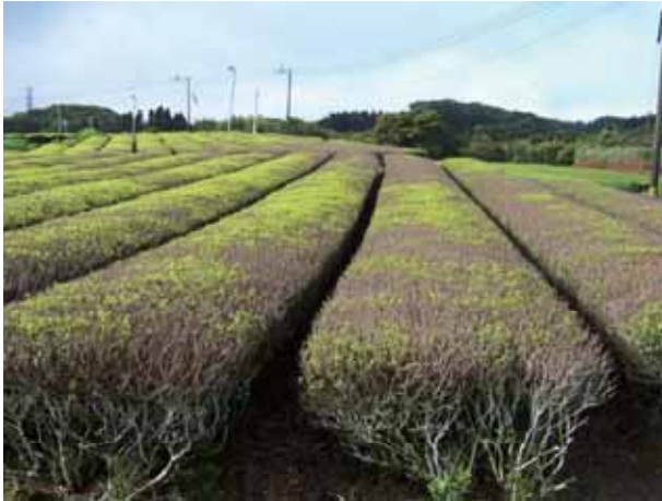
図-6 老朽化した‘くりたわせ’の茶園