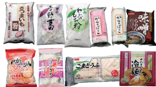
▲サツマイモでん粉を使った一般商品例

本品種の育成は、生研支援センター「イノベーション創出強化研究推進事業」（高品質・多収なでん粉原料用カンショ品種の育成）の支援を受けています。