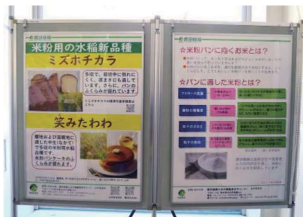
▲展示された米粉のパネル

令和5年4月3日から14日までの期間、九州農政局が主催する「消費者の部屋特別展示」に出展しました。「消費者の部屋」は、消費者とのコミュニケーションを深める場として、九州農政局により熊本地方合同庁舎（熊本市西区）1階に開設されています。出展協力した特別展示のテーマは、「お米・米粉の魅力」で、米粉に向く水稻品種「ミズホチカラ」と「笑みたわわ」のパネルとサンプル展示を行いました。これらの九州沖縄農業研究センターが開発した品種の紹介を通じて、来庁者にお米や米粉の魅力を伝えるとともに、研究成果や取り組みをアピールしました。