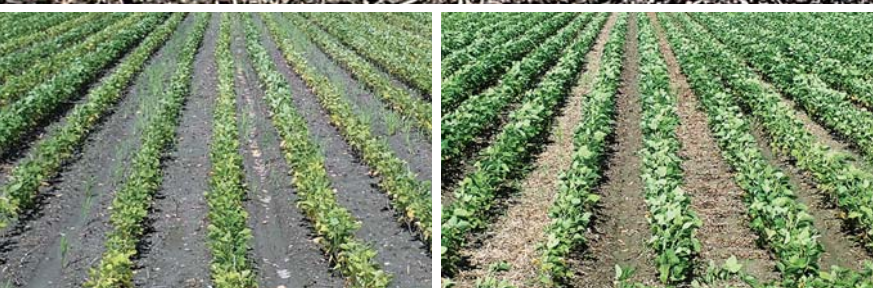
▲画像上部：今回開発した「一工程浅耕播種法」による播種風景

画像下部：ダイズの生育の様子。左は生産者慣行播種によるほ場で、湿害ストレスにより 葉の黄化が顕著。右は一工程浅耕播種によるほ場で、湿害回避効果により平均で52%増収。