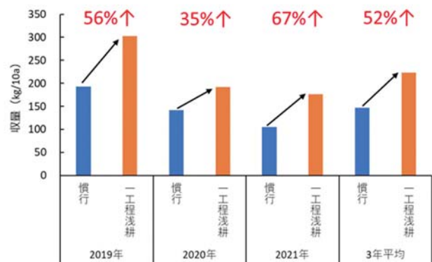
▲図3 生産者慣行栽培との収量比較