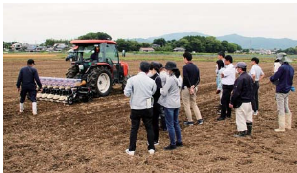
▲畝立て乾田直播機、成形された畝を見学する様子

( https://www.naro.go.jp/publicity_report/publication/laboratory/karc/news/156610.html )