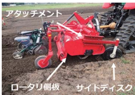
▲図1 浅耕播種機の構造

本播種法のポイントは、大型のサイドディスクをロータリ前方に、ロータリ爪の深さよりも5cm程度深い位置に取り付けることです。そのために、ディスクの取り付けに必要なアタッチメントを開発しました(図1)。