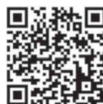
◀九冲研 農業技術研修制度のウェブサイトはこちら