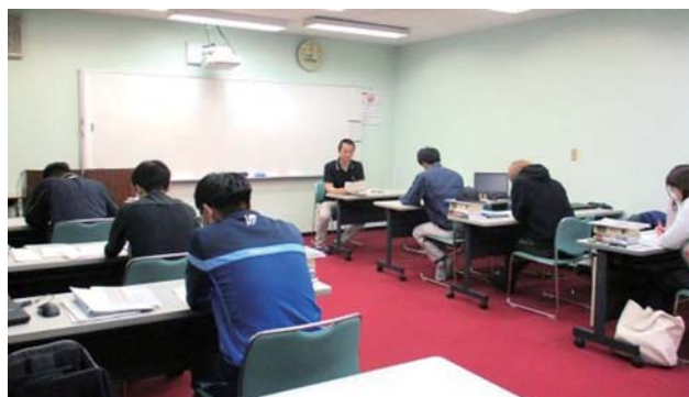
▲研修生たちとのホームルームの様子

今後は徐々にコロナ禍以前の生活に戻ると思われるので、研修生には積極的に先輩や後輩、そして職員とコミュニケーションを取っていただきたいです。そして、信頼できる仲間を作り、研修終了後も気軽に相談できるような関係を職員と築いていただきたいと思います。