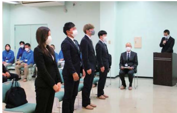
▲入所式にて所長から「入所許可」を受ける新入研修生

( https://www.naro.go.jp/laboratory/karc/yoken/index.html )