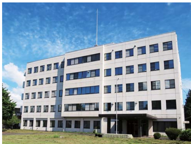
▲九州沖縄農業研究センター研究本館