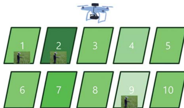
▲図 生育診断の概念図

2021年に行った本システムの現地実証試験では、倒伏や玄米タンパクの有意な増加を伴うことなく、目標値に近い実収量を得ることができました。本成果は、大規模生産者や民間企業等による利用が見込まれ、我が国の米の収量や品質の安定化に役立つことが期待されます。