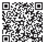
◀九冲研ニュース69号のウェブサイトはこちら

令和5年5月25日に熊本県玉名市にて、畝立て乾田直播機による畝立て同時播種の実演を行いました。九州農政局、JA、生産者など約20名に参加いただき、「乾きにくいほ場に向いている」などのご感想をいただきました。畝立て乾田直播機は高水分土壌でも播種可能な技術で、九冲研ニュース69号でも紹介しています。