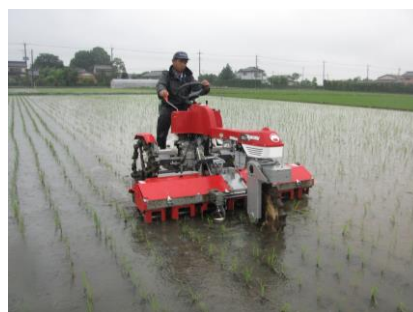
図1 高能率水田用除草機による除草作業

2015年に実用化された高能率水田用除草機は、3輪型乗用管理機の車体中央にPTOにより駆動する除草装置を搭載した除草専用機です（図1）。本機は、条間を駆動ロータ、株間を揺動レーキで除草します。作業者は除草装置や稲列を目で確認しながら作業できるため、高速で精度の高い除草作業が可能です。10a当たりの作業時間は15～20分（6条用）でイネの欠株も少ないのが特徴です。