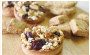
「ゆきみ六条」を用いたクッキー

寒冷地向けのオオムギとダイズの品種育成に取り組んでいます。オオムギでは「ゆきみ六条」を育成し、麦焼酎やクッキーの商品化など新規需要開拓を進めています。また、近年、食物繊維β-グルカンの健康機能性が注目されており、その含量が多く、食感にも優れるモチ性（もち麦）の「はねうまもち」を育成しました。ダイズでは、豆腐用など実需者ニーズに応じた品質と病害虫抵抗性などを備えた品種の育成を進めています。