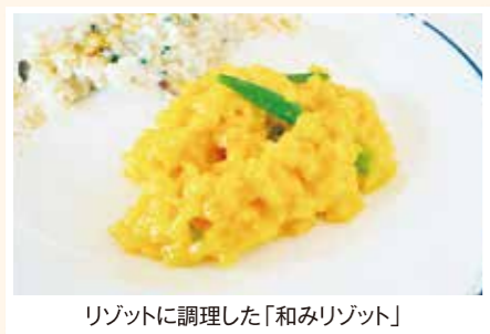
リゾットに調理した「和みリゾット」

家庭で消費される良食味米の品種育成だけでなく、食味や収量性が向上した外食・中食産業の需要に応える品種や、極多収の飼料用品種の育成にも取り組んでいます。育成した主な品種は、早生・多収・良食味の「つきあかり」、おにぎりや弁当にも最適な「みずほの輝き」、カレー用の「華麗舞」、寿司用の「笑みの絆」、イタリア料理リゾット用「和みリゾット」、米麺に適した高アミロース品種「越のかおり」、飼料米「北陸193号」です。