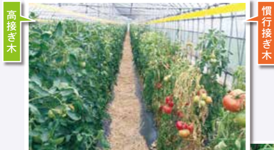
高接ぎ木のトマト青枯病防除効果

病害のまん延や経済的被害に関する要因を解析しより効率的な管理方法を開発しています。