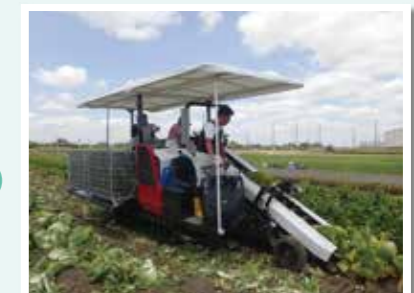
水田作露地野菜の機械化体系試験