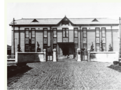
農事試験場本館（埼玉県鴻巣市） 昭和初期と思われる