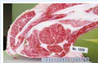
飼料用米混合飼料で肥育した黒毛和種去勢牛の枝肉断面