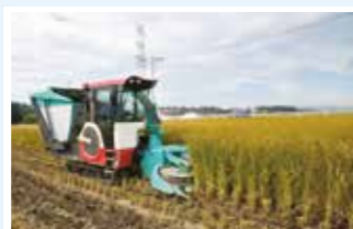
サイレージ用イネの収穫

国産飼料の生産と利用の拡大を通じた畜産経営の収益性の向上と安定化に向けて、経営分析、開発技術の経済性評価、耕種と畜産の部門間連携による生産組織化方策の解明に取り組んでいます。