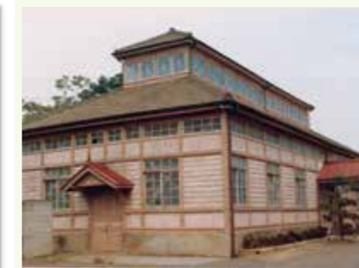
農事試験場展示館（埼玉県鴻巣市） 1978年撮影