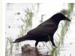
水田を歩く ハシボソガラス