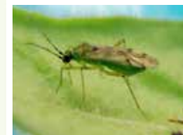
捕食性天敵 タバコカスミカメ

作物保護のための総合的な虫害・線虫害・鳥獣害管理に関する技術開発及びその体系化の研究を行っています。研究対象は、作物の根に寄生するネコブセンチュウ類やシストセンチュウ類、野菜の地上部を加害するハダニ類、アブラムシ類、コナジラミ類、アザミウマ類などの害虫とその天敵、果樹や花木の害虫であるコナカイガラムシ類やカミキリムシ類、イネを加害するヒメトビウンカやイチモンジセセリなどの害虫、さらにカラスやスズメなどの鳥類、ハクビシン、シカ、イノシシなどの哺乳類まで多岐にわたります。