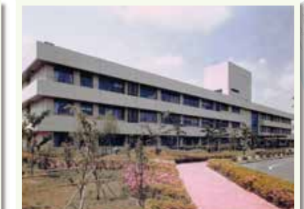
農業研究センター本館（現在の農研機構本部） 1985年頃撮影