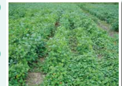
帰化雑草マルバドクが侵入した大豆畑

東海地域（静岡、愛知、岐阜、三重）の水田作における水稲・麦類・大豆を中心とした安定・多収技術の開発を行っています。