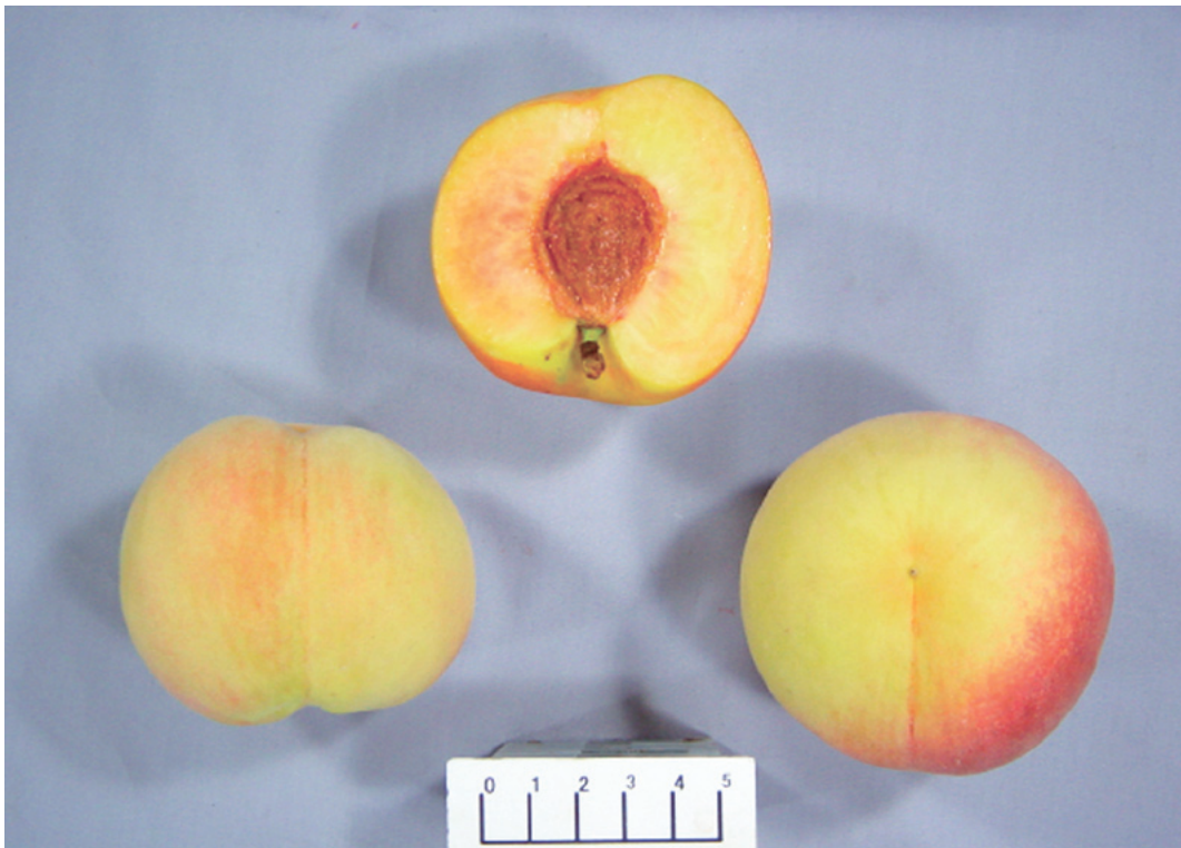
Fig. 2 Fruit of 'Tsukiakari'