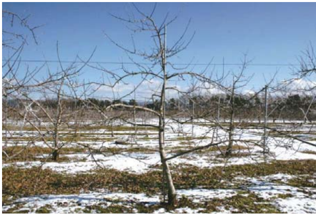
Fig. 2 Tree of 'Santaro' on JM 7 (8-years-old).

は白色を呈する。開花前の花の色は淡黄色で、花粉の量は豊富である。三倍体品種であるため花粉の稔性は低く、'さんたろう'は主要品種に対する受粉樹としての利用には適さない。