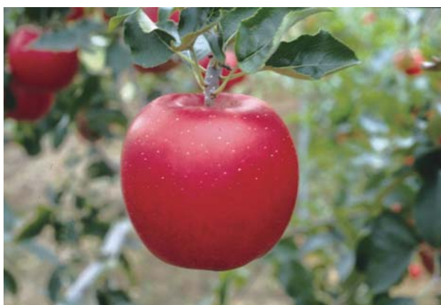
Fig. 3 Fruit of ‘Santaro’.

‘さんたろう’は三倍体であるため大果となりやすく、果実の大きさは350 g前後と‘千秋’より大きい。果形は円形で、王冠は「無」、がくの開閉は「閉」、がくあいの深さは「中」、広さは「広」、こうあの深さは「深」、広さは「広」である。果皮色は濃赤色(日本園芸植物標準色票値0409)で、果皮全面が美しく着色し、外観は良好である。果点の大きさは「小」、密度は「中」、