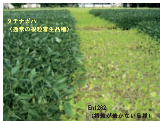
写真 根粒が着かない品種では生育が著しく劣る低地力窒素ほ場においても、地下水位制御と肥培管理によって根粒活性が大幅に向上するので、普通品種では青々とした旺盛な生育が得られます。