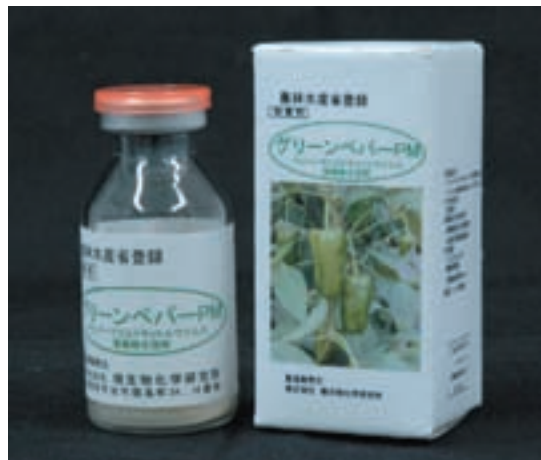
図1 ピーマンモザイク病を予防する植物ワクチンのパッケージ(試作品)

ショウガの根茎腐敗病対策では、代替化学剤を基礎とした新規栽培マニュアルを開発しています。基本となる代替土壌くん蒸剤は、クロルピクリンを用います。また最近、1,3-ジクロロプロペンとメチルイソチオシアネートの混合剤、生育期でのジアゾファミドの灌注処理、アゾキシストロビンとメタラキシルMの混合剤およびヨウ化メチル剤も農薬登録されました。今後期待されるアミスルブロム