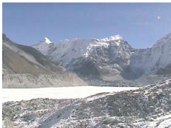
図3 ヒマラヤ・ナムチエのフィールドサーバ(左写真)とフィールドサーバが撮影したイムジャ氷河湖の画像(右写真)