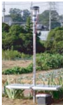
埼玉県 (無農業栽培農場)