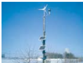
北海道 (未来農業集団)