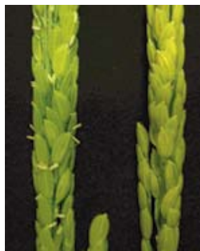
図2 閉花受粉性イネの穂 左:台中65号、右:閉花受粉性イネ 閉花受粉性イネではおしべが花の外に出ない。