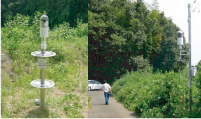
図2 不法投棄現場(つくば市内)における実験の様子

つくば市は東京に近い田園都市であるため、休耕田や里山で産業廃棄物の不法投棄が増えています。小さな不法投棄を放置するとあつという間に巨大な産廃の山になってしまい、その撤去には巨額のコストがかかります。そこで、複数のカメラで周囲360度を撮影できるフィールドサーバと高解像度カメラを搭載したフィールドサーバを不法投棄監視に用いた実証実験をつくば市と共同で行っています(図2)。