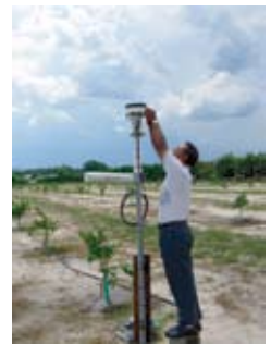
フロリダ (フロリダ大)