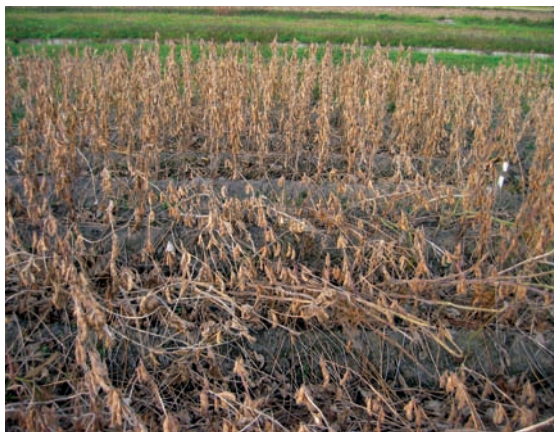
手前：エンレイ 後方：里のほほえみ

注. 1) 2008年東北農業研究センター大仙研究拠点 普通畑産。 2) 2008年6月4日播種、畦幅75cm、株間16cm、1株2本立。