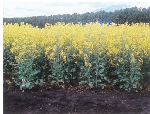
写真3 開花盛期の「ななしきぶ」(育成地)

草型は“ ”で、主茎の下部から出る分枝は少なく、「キザキノナタネ」と同様の草型である。草丈は「オオミナタネ」より長く、「キザキノナタネ」より短い“中”に属する。第1次分枝数は“やや少”で、「オオミナタネ」と同程度、総分枝数は「オオミナタネ」より少ない“やや少”である。第2本葉の形は“丸形”で、茎を抱く葉はない。葉色は“緑”で、葉の欠刻は“深く”、葉及び茎・莢のアントシアニンは“無”である。花色は“黄色”で、葯の赤点は「オオミナタネ」、「キザキノナタネ」の“無”に対し、“有”である。穂長は「オオミナタネ」と同程度の“中”、1穂莢数は「オオミナタネ」より多く「キザキノナタネ」より少ない“やや多”で、莢長は「オオミナタネ」より長い“中”、1莢結実数は「オオミナタネ」と「キザキノナタネ」より多い“やや多”である。粒色は“黒”、粒大整否は「オオミナタネ」並の“整”である(表3、写真1、写真2、写真3)。