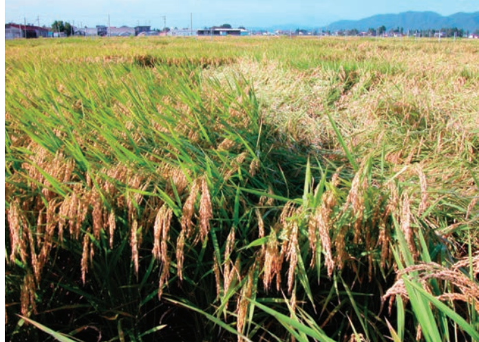
写真2 圃場における「きんのめぐみ」の草姿 (左：きんのめぐみ、右：あきたこまち、2010年9月育成地)