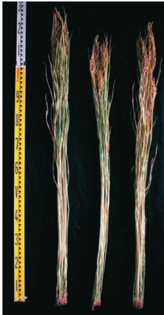
写真1 「きんのめぐみ」の草姿 (左：きんのめぐみ、中：ひとめぼれ、 右：あきたこまち、2010年育成地産)