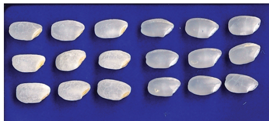
写真4 胚盤が残るように精米した「きんのめぐみ」 左：胚盤が残る精米 (2010年美郷町産米をトーヨーライス株式会社で精米、搗精歩合：91.2%) 右：通常の精米 (2010年育成地産米、搗精歩合：88.9%)