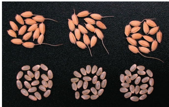
写真3 「きんのめぐみ」の粳および玄米 (左：きんのめぐみ、中：ひとめぼれ、右：あきたこまち、2010年育成地産)