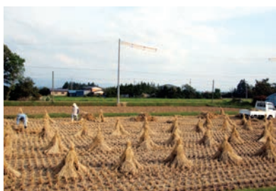
図1/立ちわらの乾燥

稲わらは全国で約900万t生産されていますが、飼料利用は約1割で、約7割はすき込み等消極的な利用となっています。現在の北東北での稲わら収集作業では、自脱コンバインの結束装置で結束された稲わらを人手で4本立てにして圃場乾燥するのが一般的です(図1)。これには多大な労力が必要で、天候によっては2~3週間経っても乾燥が進まず、ニーズに応じた量・品質の確保が難しい状況にあります。