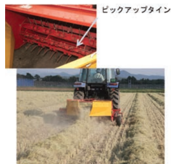
図3/スワースコンディショナによる反転

コンディショナの利用を検討しました。スワースコンディショナと圧碎稲わらとの相性は良く、ピックアップタイムで稲わらを拾い上げ、勢い良く後方の集草板に衝突させることで、圧碎稲わらを反転する作用がありました(図3)。その結果、午前1回のスワースコンディショナによる反転を組み合わせることで、稲収穫後2日目に含水率15%まで低下し(図4)、反転無しに比べて1日早く梱包作業をすることが可能となりました。