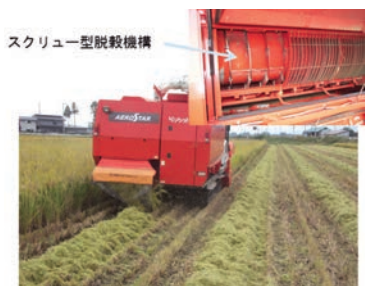
図2/汎用コンバインによる収穫

汎用コンバインは、一般的な自脱コンバインとは異なり、刈り取った作物の全て(穂と茎葉)を脱穀部に供給して脱穀するコンバインです。私達は、汎用コンバインのスクリー型脱穀機構で稲わらが圧碎される(以後、「圧碎稲わら」という)ことに着目し、15cm程度の条間の狭い栽植様式と、刈株の上に稲わらを排出させる技術を組み合わせ、稲わらを2~3日で迅速に乾燥させる技術を開発しました(図2)。