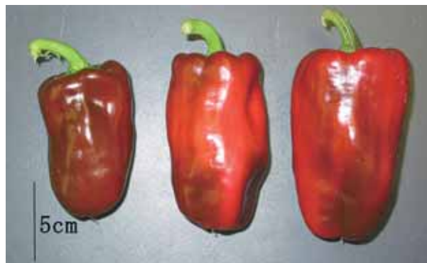
図-4 ‘台パワー’の完熟果実