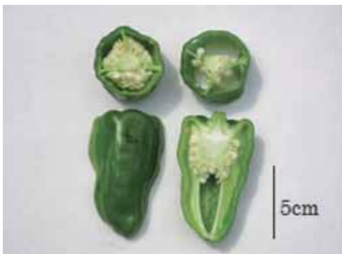
図-3 ‘台パワー’の未熟果実