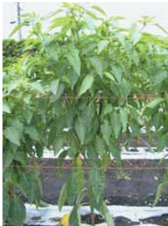
図-2 ‘台パワー’の植物体

兵庫県では2006年度にすべての品種で発病株が見られず、判定不能であった（表-10）。罹病性の‘エース’の発病株率は千葉県ではすべての年度で100%に達したが、兵庫県および宮崎県ではその発病株率がそれぞれ35.3~88.9%および35.0~100.0%とやや低かった。‘台