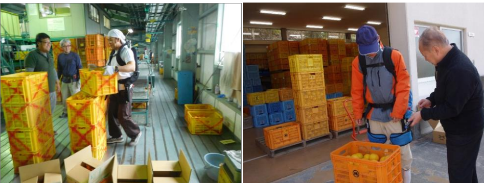
選果場内におけるコンテナの積み上げ作業