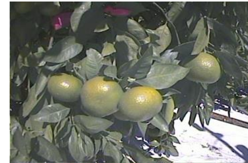
カメラ撮影による果実の状態