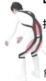
簡易型アシストスーツ