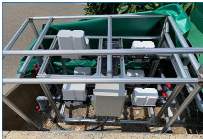
遠隔自動灌水システム