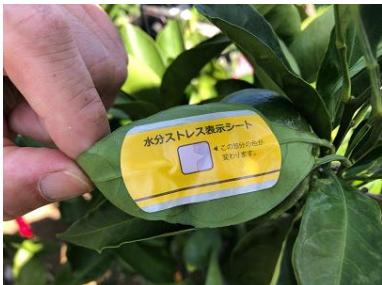
水分ストレス表示シート