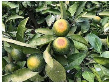
温州みかんの日焼け果