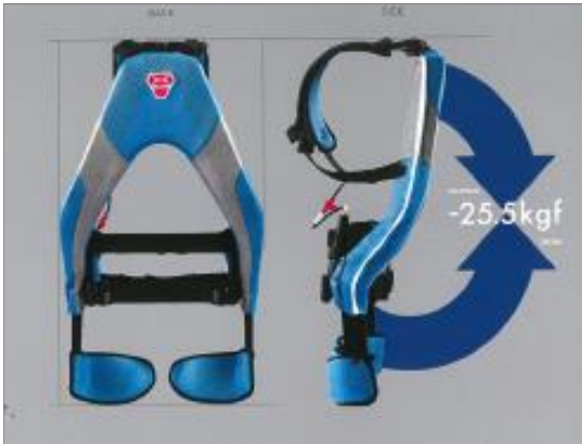
調査用アシストスーツ

アシストスーツは、農作業を補助する動力や人工筋肉を用いた装着型の機械で、カンキツ生産における農作業の軽労働化に繋がるものと期待